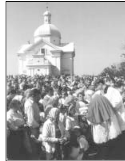
Pout k ern madon loretnsk / Wallfahrt zu der Schwarzen Madonna von Loretto

Virtuosi di Mikulov, Břeclovsk komorn orchestr / Breclaver Kammerorchester, Jakub Janřta – varhany / Orgel Říd / Leitung doc. Lubomr Mtl