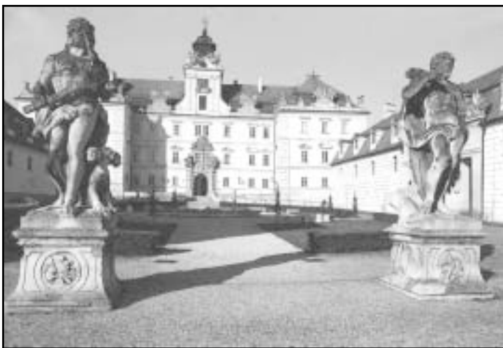
Zámek Valtice / Schloss Valtice

Svatý kopeček navštěvují poutníci od roku 1623. ... „Černá jsem a přece krásná... Synové... udělali ze mne strážkyni vinic.“ Tyto verše z biblické Písně písní jako by napsal Šalomoun o Mikulovu a jeho patronce Černé madoně loretánské. Socha, původně umístěná v mikulovské lořetě, vystupuje každoročně v první zářijovou neděli na vrchol Svatého kopečku, aby odtud přehlédla město a jeho vinice, v nichž právě dozrává úroda – výsledek celoroční práce zdejších lidí. (Z knihy Mikulov – město, ve kterém zpívají domy.)